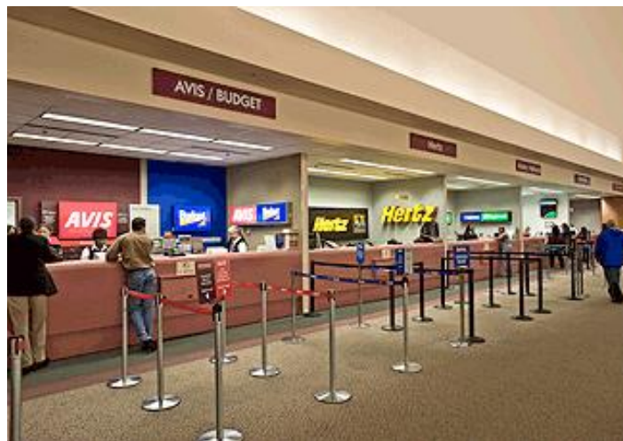
ФОТО можливого вирішення питання

Тож, створення зони представництва для зазначених світових брендів та зрозуміла наочна навігація, що скеровуватиме гостей до звичного їм сервісу, не лише суттєво покращила б інфраструктуру аеропортів, але й позитивно вплинула б на імідж країни в цілому. Бо зараз дуже нелегко пояснювати зарубіжним гостям, чому становище з доступом до автопрокату в нашій європейській країні гірше, ніж в деяких африканських.