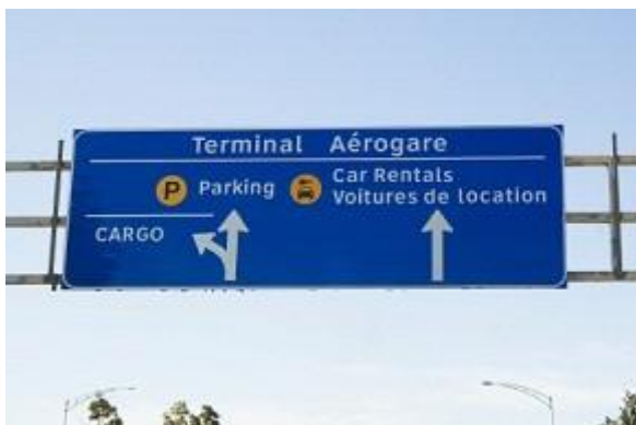
ФОТО можливого вигляду показників до місць паркування

І друга, надзвичайно важлива сторона цієї ж проблеми полягає в повній відсутності спеціально відведених місць для стоянки прокатних авто та навігації, яка б допомогала такі місця легко розшукати. Це призводить до колосальних незручностей, як для надавачів послуг, так і для бажаючих отримати прокатне авто. Перші мусять деінде припаркувавши замовлений автомобіль, бігати по залу прильоту з намальованим на папері логотипом компанії та, буквально, вилловлювати замовника послуги прокату. А другі не знають де автомобіль можна покинути після завершення строку прокату. Таким чином, очевидно – що просте адміністративне рішення про виділення стояночних місць для прокатних автомобілів надало б по-справжньому цивілізованих рис нашим аеропортам.